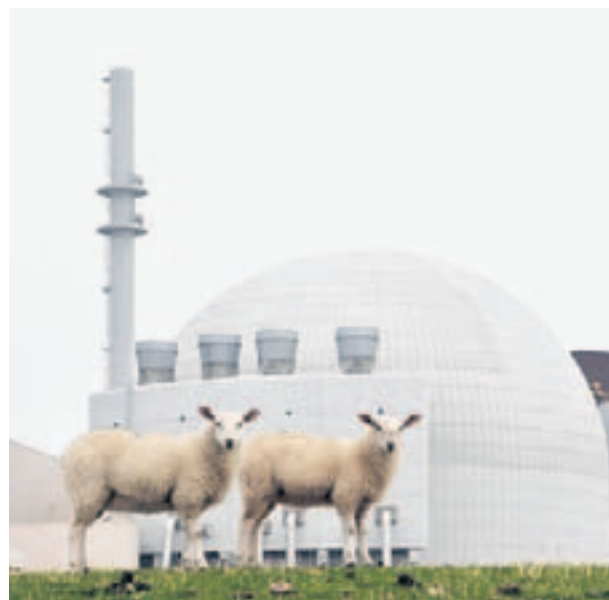
Das Atomkraftwerk Brokdorf ist das Symbol der Anti-Atomkraft-Bewegung. Heute weiden dort Schafe auf dem Deich.

VON CHRISTIAN SALEWSKI (TEXT) UND ANDREAS LABES (FOTO)